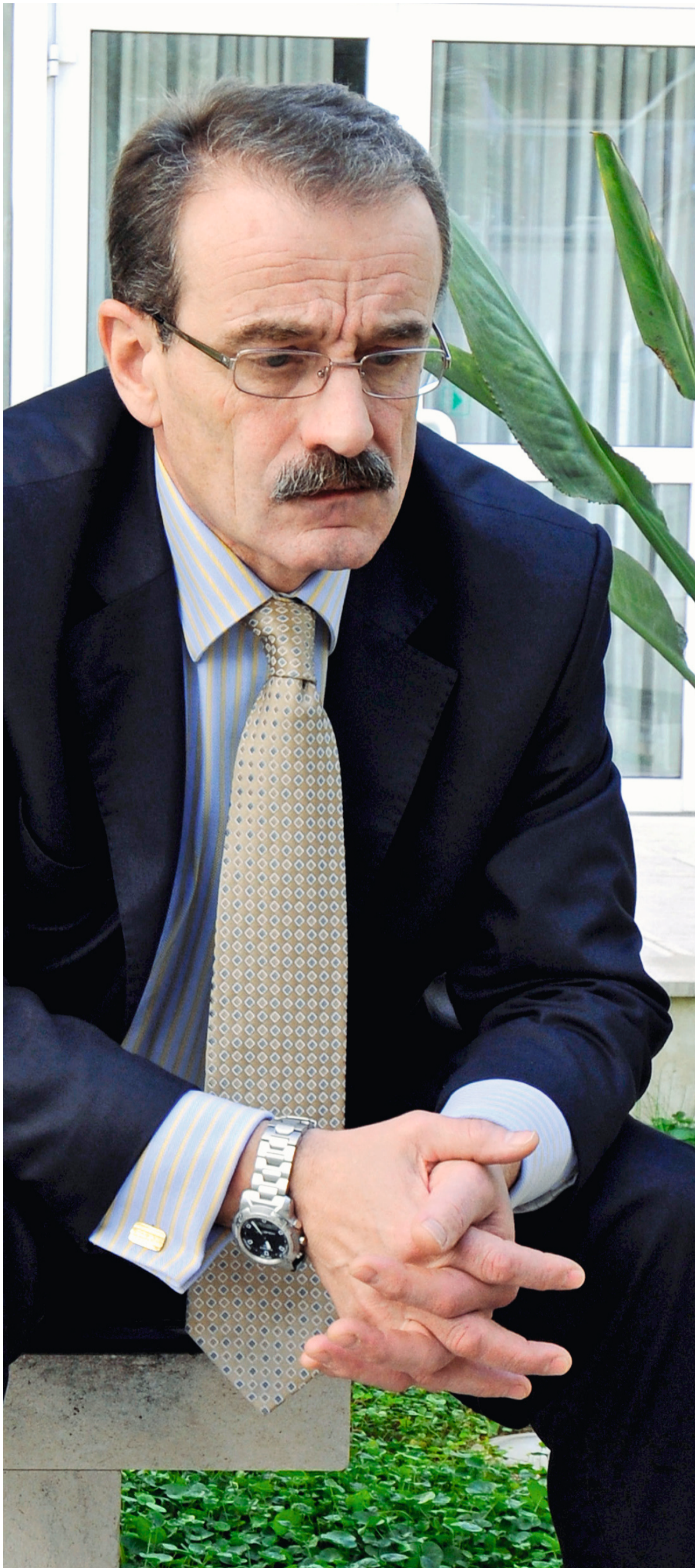
Važno je oblikovanje svijesti po kojoj moji unuci neće morati živjeti po obrascu odbojnosti, da ne kažem mržnje prema drugima, u nekakvoj samozadovoljnoj etnoizolaciji